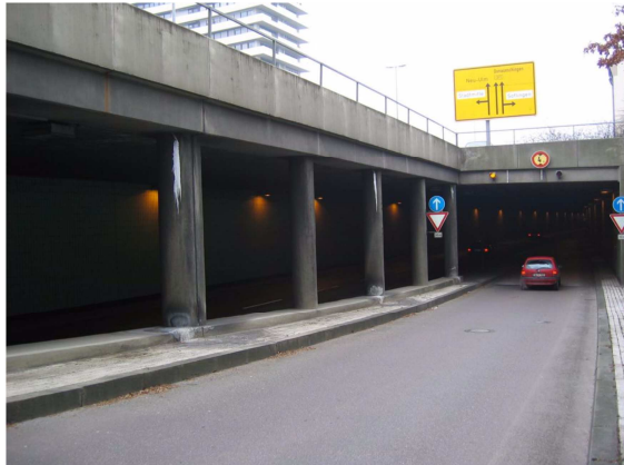
Galeriebauwerk mit Einleitungsstrecke im Tunnel Bismarckring Ulm