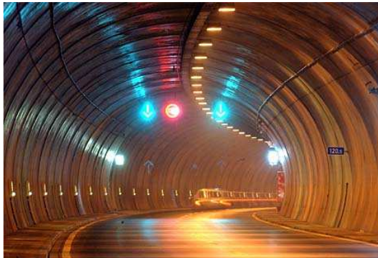
Überprüfung der Selbstrettungsmassnahmen in einem bestehenden Tunnel