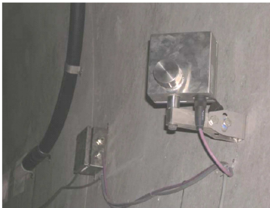
Aerodynamische Abnahmemessungen (1D Ultraschall - Strömungsmesssystems zur berührungslosen Messung der Strömungsgeschwindigkeit)